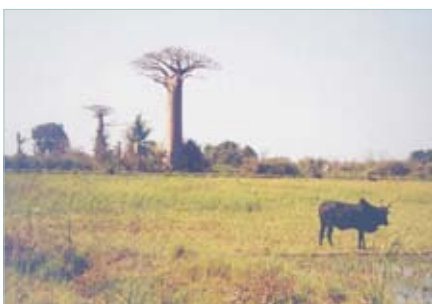
Reis und Zebu, zwei wichtige Lebensmittel Madagaskars im noch unverarbeiteten Zustand.