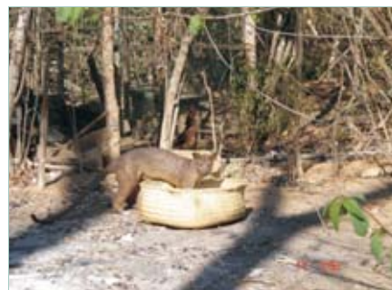
Fossas, die größten madagassischen Raubkatzen, die das Lager regelmäßig besuchen, stellten ein Sicherheitsrisiko dar.

Dies betrifft allerdings nicht nur willkommene Gäste wie Sifakas oder Makis. Problematischer war schon, daß auch zwei Fossas, die größten madagassischen Raubkatzen, das Lager regelmäßig besuchten und an und teilweise in den Zelten nach Freßbarem suchten. Zwar greifen Fossas üblicherweise keine Menschen an, da aber niemand ausschließen kann, daß sie es dennoch tun, wenn sie überrascht oder erschreckt werden, stellten sie doch ein Sicherheitsrisiko dar. Sie wurden daher in Fallen gefangen und gut 20 km vom Camp wieder ausgesetzt. – Ob dies allerdings von dauer-