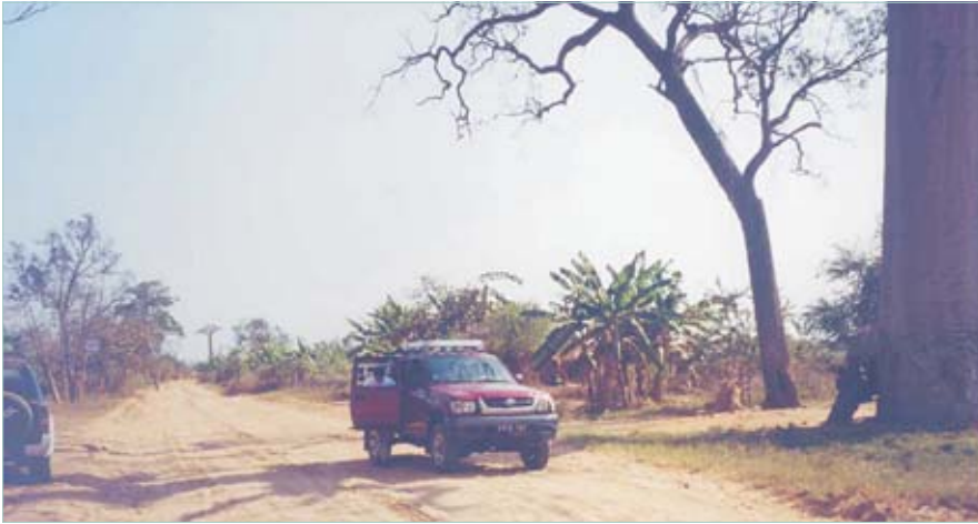
Der DPZ-Toyota im Einsatz auf der "Bundesstraße" von Morondava nach Belo Tsiribin.

haftem Erfolg ist, ist eher fraglich. Bei einer früheren vergleichbaren Aktion waren die Tiere nach wenigen Tagen wieder da.