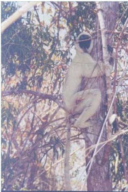
Ein Larvengifaka in unmittelbarer Nähe zum Camp – Beobachtungen aus der Hängematte wären durchaus möglich.

ist, daß wir zur Finanzierung der Villa Mirza Mittel einsetzen konnten, die die Sparkasse Göttingen durch eine Spende zur Unterstützung der Forschungsarbeiten des DPZ zur Verfügung gestellt hatte. Herzlichen Dank!