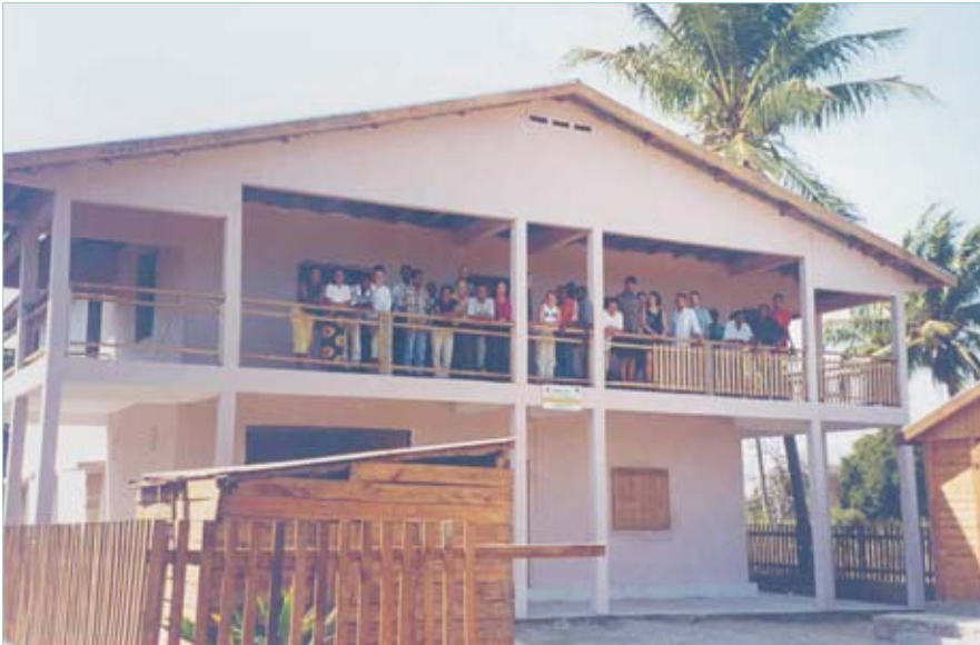
Die komplette DPZ-Mannschaft auf der Veranda der Villa Mirza.

Unsere Feldstation im Forêt de Kirindy wurde im vergangenen Jahr aufwendig saniert, so daß nunmehr für Personal und Gerät wirklich gute Arbeitsbedingungen bestehen. Allerdings war noch ein Problem zu lösen. Die Basisstation in Morondava, die Ausgangspunkt für alle Aktivitäten im Wald ist, befand sich in einem angemieteten, fast 100 Jahre alten Holzhaus. Abgesehen davon, daß das Gebäude in der Substanz dem Alter entsprechend zunehmend marode wurde, waren alle Installationen, insbesondere die Elektrik und der Sanitärbereich akut dringend sanierungsbedürftig. Dies hätte einen Aufwand von 15-20 TEuro erfordert, den der Vermieter, eine Kirchengemeinde, nicht hätte realisieren können. Da das DPZ auch nicht in fremdes Eigentum investieren wollte und bei der Sanierung der Feldstation die Erfahrung machen konnte, daß bei den dortigen Preisen mit relativ geringem Geldeinsatz solide Gebäude geschaffen werden können, reifte der Entschluß, ein eigenes Haus als