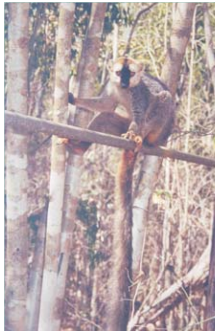
Ein Rotstirnmaki auf der Wasserleitung des Camps.

Der Forêt de Kirindy, in den es im Anschluß an die Einweihungsfeier in Begleitung des Staatssekretärs ging, ist auch gegen Ende der Trockenzeit, wo alles staubig, die Bäume verdorrt und noch viele Tiere im Winterschlaf sind, ein Erlebnis. Die