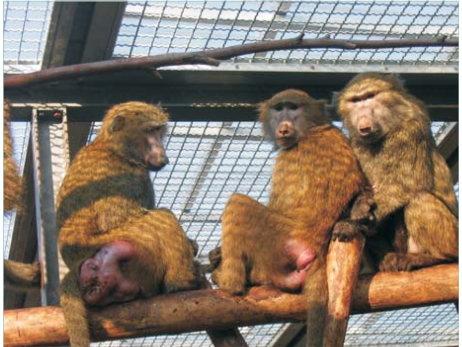
Eine neue Primatenart im DPZ: der Anubispavian ( Papio anubis ).

Seit dem 16. September hat sich das Artenspektrum, der am DPZ gehaltenen und gezüchteten Primaten, um eine Spezies erhöht. Es handelt sich dabei um eine weitere Pavianart, den Anubispavian ( Papio anubis ). Somit werden am DPZ zurzeit neun verschiedene Primaten (Rhesus-, Javaner- und Bartaffe, Mantel- und Anubispavian, Totenkopffaffe, Lisztaffe, Weißbüschelaffe, Schwarzweiße Varis) und die Spitzhörnchen gehalten. Die Anubispaviane wurden von der Universität München (LMU) über-